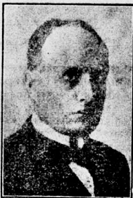
ইটালিব অধিনায়ক ছিবন মুছোলিনি

মুটিজাব কাম নচলে।" খঙতে মোব গা কপিংলৈ ধরিলে; ভাবিলো,—একে টাজোনে মাহুহটোব দুবতো ডিবাংরি কহো। কিন্তু পাছ দুহুইতেই মনে পবিল টকাব মোমোটা তাব হাতত হে। সেই দিনা সন্ধ্যা মই মোব পাৰশপীয়া ধনবিনি তিছাপ কবি লৈ মোব কোতাংমোব মেঘামত কবিলো আক বেলেত উঠি লুহানব ফালে বাধা কবিলো। লুহানো পাই কেইদিনমান কোনোকমে কটাগে। তাব পাছত হাত উংগ হৈ পবিল। জেপত কাশ'মার্কিব মোহর মযা এটা তামব পপকব বাহিবে এটি পয়হাও মোহোবা হ'ল। গোটাই দিনটো অনাধারে গ'ল। সন্ধ্যা ভোকত পেট পুবিংলৈ ধরিলে। এখন উভানলৈ গৈ এটা মধর মুস্তিব তলত বহিলোগৈ। দুব ডাঙি চাওঁ—মুস্তিটা বীলিচাম উঠেব। মোব কম বেদি মুস্তি চাওঁলে অহা মাহুহবোবে ভয়ত ঝাঁতবিংলৈ ধরিলে।